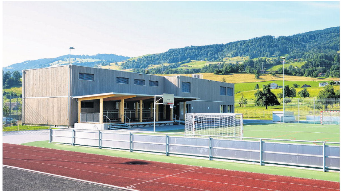
Das Schulhausprovisorium nebst Sportplätzen auf dem Autobahndach in Altendorf kann sich sehen lassen.

Zuvor wird die Bevölkerung die Gelegenheit haben, der alten Turnhalle einen würdigen Abschied zu geben. Denn so, wie möglicherweise einige Schüler ihre gesamte Primarschulzeit im neuen Provisorium erleben werden, haben nicht wenige Altendörflerinnen und Altendörfler viel Zeit in der alten Turnhalle verbracht und einige Erinnerungen daran. Der Dorfchilbi-Verein organisiert am 4. Juli eine